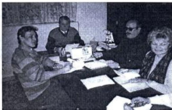
Zo zasadnutia OZ

Obecné zastupiteľstvo prostredníctvom OcÚ prerokovalo so SAD Rožňava a SAD Revúca udržanie autobusovej linky v dolnej časti obce o 13.20 hod.